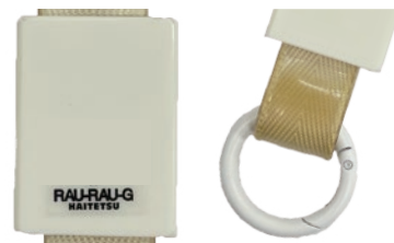
▲ブランドネームシール ▲カラビナ使用