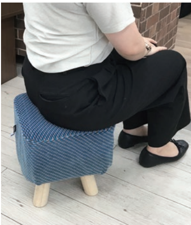
▲使用イメージ(ブルー)